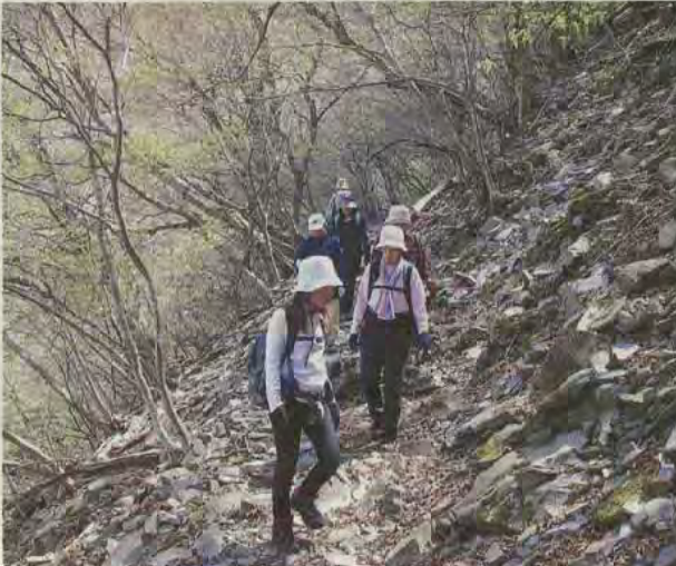
「バードライン」を歩く。初心者には格好の自然道だ